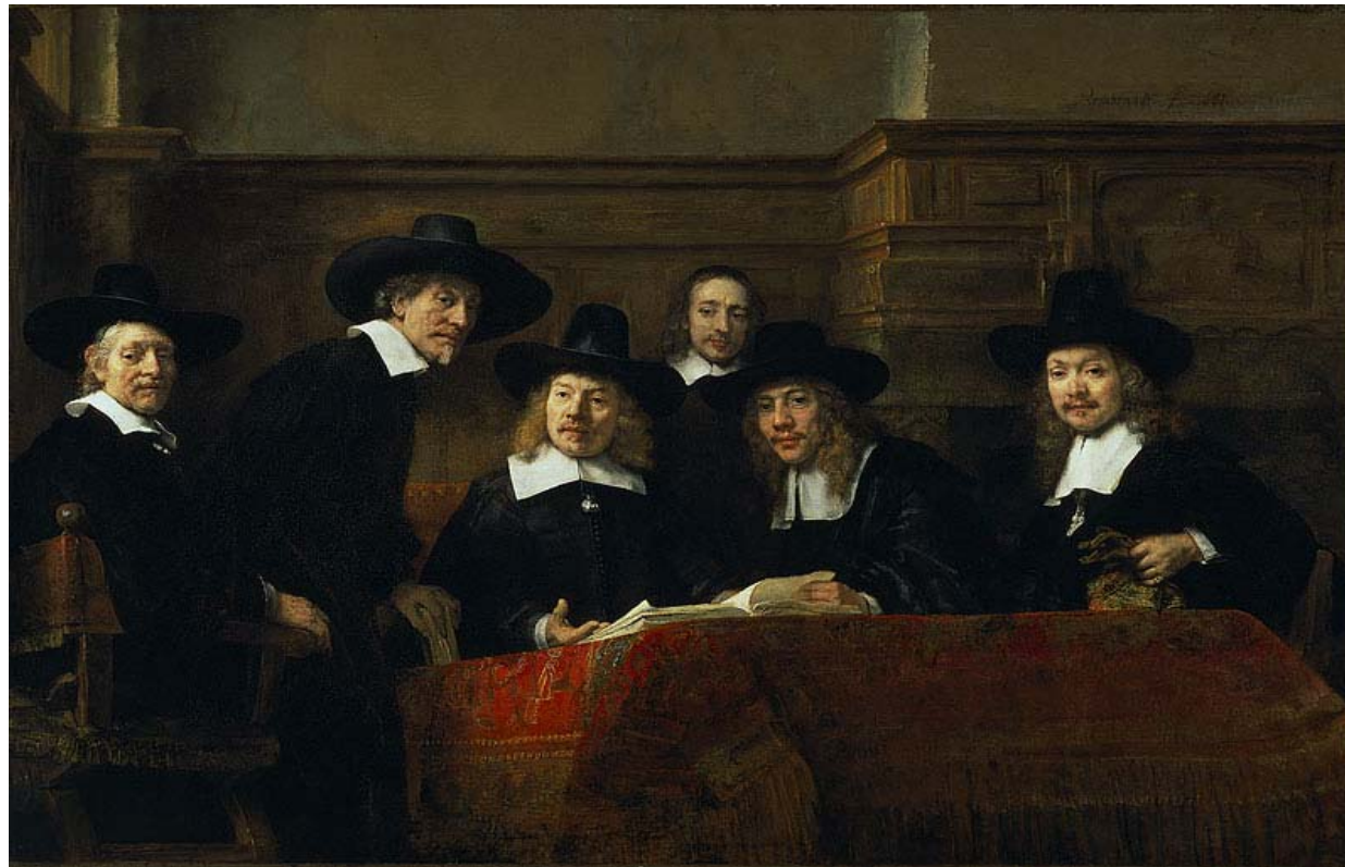
Research Institute for Transaction Management